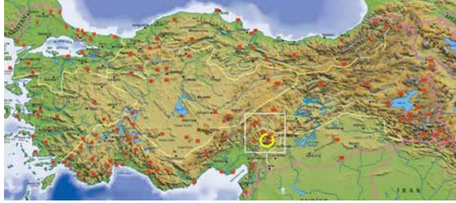
1. Binboğa Dağları ÖBA 2. Keklikoluk ÖBA 3. Berit Dağı ÖBA 4. Engizek Dağı ÖBA 5. Kayranlı Dağı ÖBA 6. Ahır Dağı ÖBA

Önemli Bitki Alanı (ÖBA) , olağanüstü zengin bir bitki örtüsüne sahip, nadir ve/veya endemik (dünyanın başka hiçbir yerinde doğal olarak yetişmeyen) bitkileri içeren doğal ya da yarı doğal alandır. ÖBA'lar bilimsel ve uluslararası kriterlere göre belirlenir. Bu kriterler kısaca, bir alanın Avrupa ve dünya ölçeğinde tehlike altında bulunan nadir ve endemik bitki türleri, habitatları ve bunlara ait zengin örnekleri içermesi şeklinde özetlenebilir. Kahramanmaraş'ta 6 Önemli Bitki Alanı (ÖBA) tanımlanmıştır: Ahır Dağı, Berit Dağı, Binboğa Dağları, Engizek Dağı, Kayranlı Dağı ve Keklikoluk ÖBA.